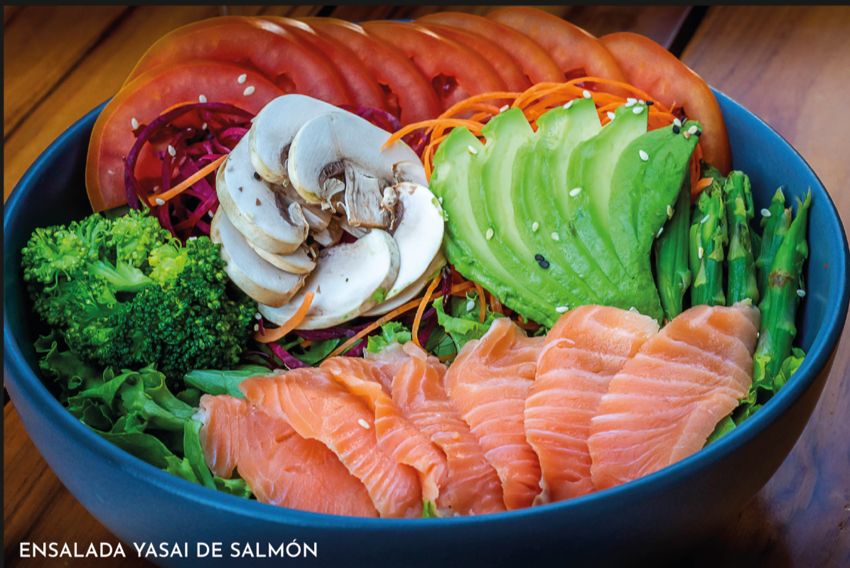
ENSALADA YASAI DE SALMÓN

Mix de lechugas (lechuga italiana, orejona, col morada), Kakiage de zanahoria, julianas de chicharos japoneses a la plancha, espárragos blanqueados, cebolla morada, tiras de wonton frito, cubos de atún a la plancha.